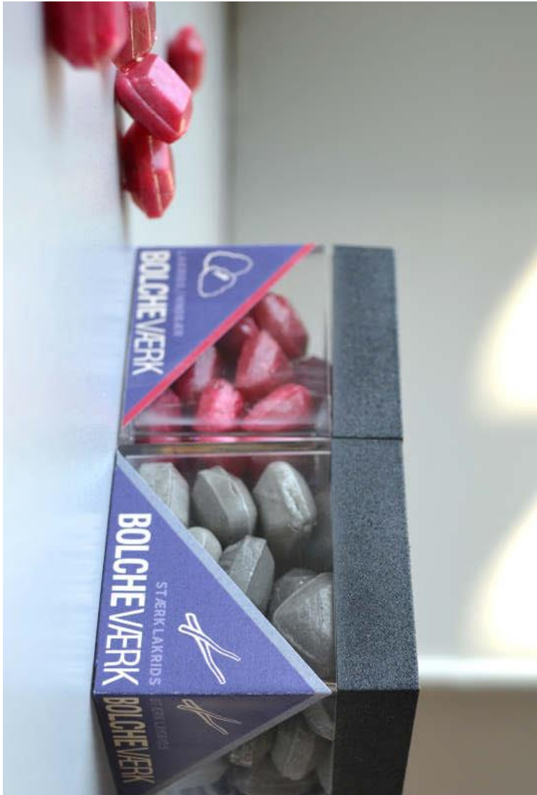
شکل ۳: پروژه نخست، طراحی بستهبندی آنبات برای فرارگیری در قفسه.