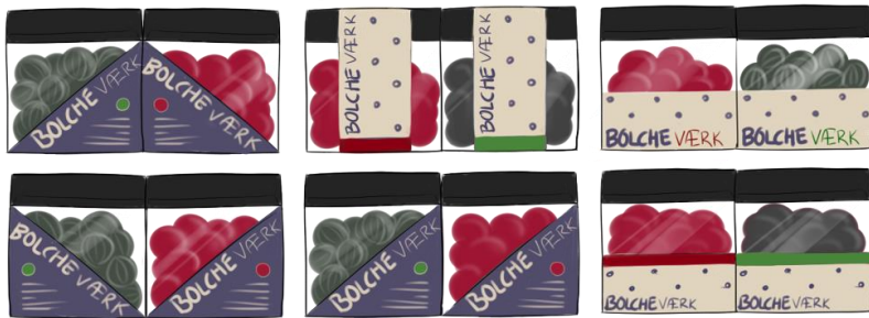
شکل ۲: طرح نهایی پروژه نخست، طراحی بسته‌بندی آب‌نبات برای قرارگیری در قفسه.